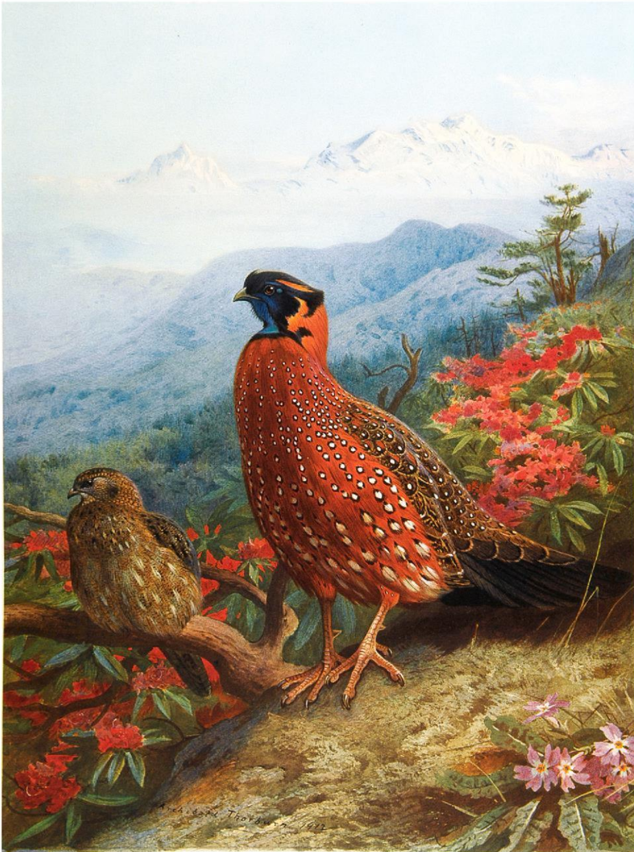
THE SATYR TRAGOPAN.