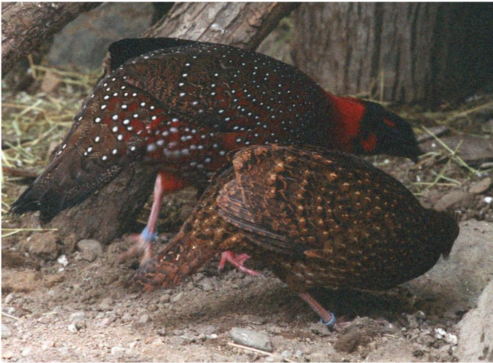
Tupp under uppvaktning av hönan

Frontuppvisningen är särskilt spektakulär. Tuppen vetter mot hönan från ca 1 m avstånd, kröker sig ner något, rasslar med sina fjädrar, sträcker ut sina vingar och klappar vingarna mot marken. Han nickar på huvudet och upprepar detta med ökande hastighet. Hans horn blir uppblåsta, hans haklapp fälls ut, och fågeln rycker och rasslar med sina fjädrar. Han gör också ett väsende ljud. När haklappen har blivit helt utfälld, kommer tuppen att stoppa sin dans, flytta sig närmare hönan och fortsätta visa henne sin haklapp. Han slappnar sedan och hornen och haklappen drages ihop. Häckningen sker normalt från maj till juni, vissa fåglar på högre höjder börjar inte häcka förrän i juli, på grund av senare vår på högre höjder. Redet är gjord av pinnar och kvistar och är byggd över markytan, i träd och buskar på en höjd av 6 m eller mer. Det är väl dolt från insyn. I naturen är en typisk äggkull två till tre ägg. I fångenskap kan hönan lägga fyra till sex ägg och ibland så många som åtta ägg. De ljus rödbruna äggen har små mörkare